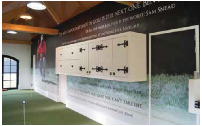
INDOOR RUIMTE VOOR DE REGENACHTIGE DAG

nieuwe wensen bijkomen. We hebben dit proces zelf begeleid, want tot twee uur voor de levering werden er nog aanpassingen gevraagd. Ook het type verlichting werd zelfs op het moment van inschroeven nog veranderd. Maar als je het proces zelf meemaakt, dan snap je het ook waar die wens vandaan komt en het was ook steeds een verbetering”, zegt Mark.