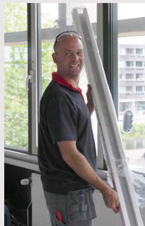
◀ De chef monteur aan de slag met het “helpende handje”

Twee opdrachtgevers “Voor Hollander Techniek is dit een leuk project”, zegt